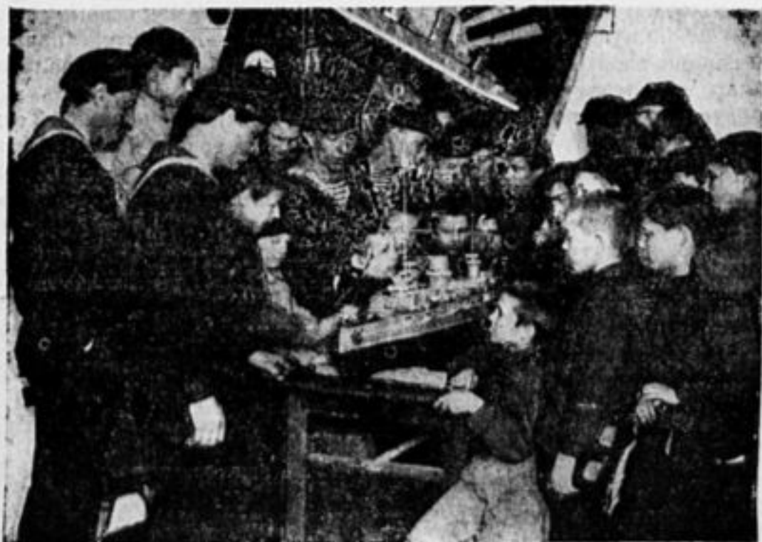
Комсофлотцы „Марата“ показывают пионерам модель своего корабля.