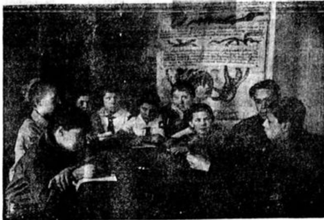
В начале 1923 г. в ЦДКВР отирылась общесоюзная конференция юных пионеров. На снимке президиум конференции. На конференции присутствовало более 150 делегатов. Это была первая пионерская конференция.