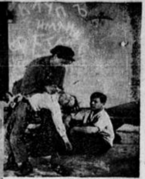
2 клуба в картине „Даешь радио“.

ник. Комическая часть картины построена на умелом обращении компании Федьки с приемником.